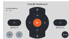
Software intuitivo e facile da usare