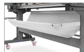
Area di lavoro sempre pulita grazie all'ampia sacca di raccolta sfridi