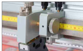
Regolazione micrometrica della posizione dei coltelli (NEW fornita di serie)