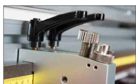
Vite di registro pressione della lama