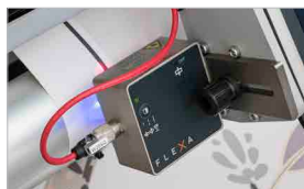
Sensore ottico per l'allineamento verticale automatico