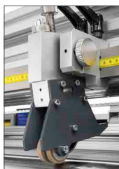
Coltello compatto longitudinale a lama rotante, singolo o doppio (optional)