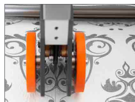
Coltello longitudinale a lama rotante singola con cuscinetto (lama doppia optional)