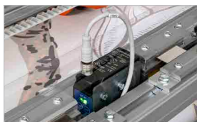
Letture avanzate dei crocini